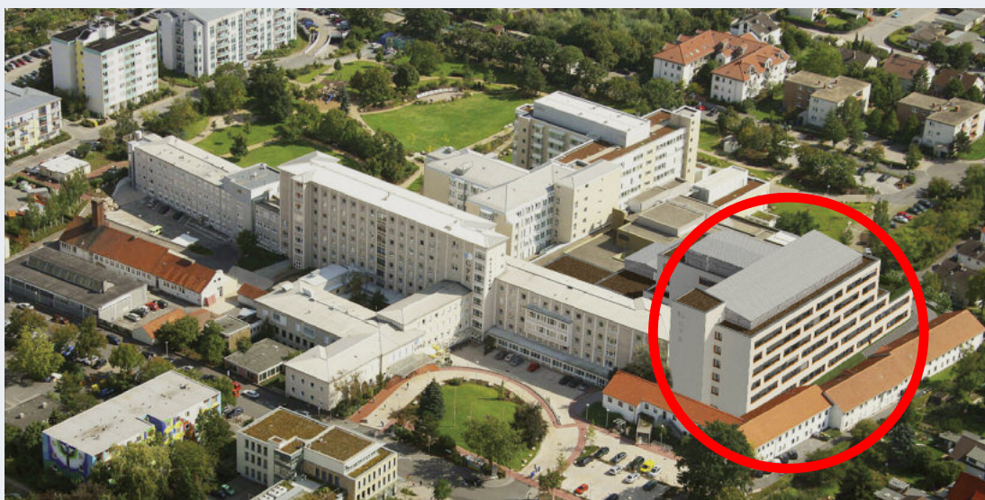
So wird das neue Betten- und Funktionshaus C am GPR Klinikum aussehen

Die Angebote finden im Rohbau des Bettenhauses C statt!