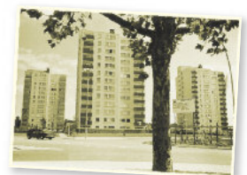
Historisches Foto vom „Dicken Busch“ in Rüsselsheim

Um rechtzeitig mit der Planung beginnen zu können, bitten wir um Rückmeldung bis zum 19.09.2013. Wir freuen uns auf Ihr Kommen.