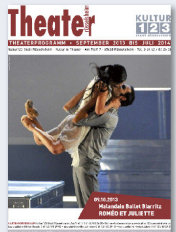
Die Titelseiten der Programmhefte für Volkshochschule, Jazz Fabrik und Theater Rüsselsheim (von links)