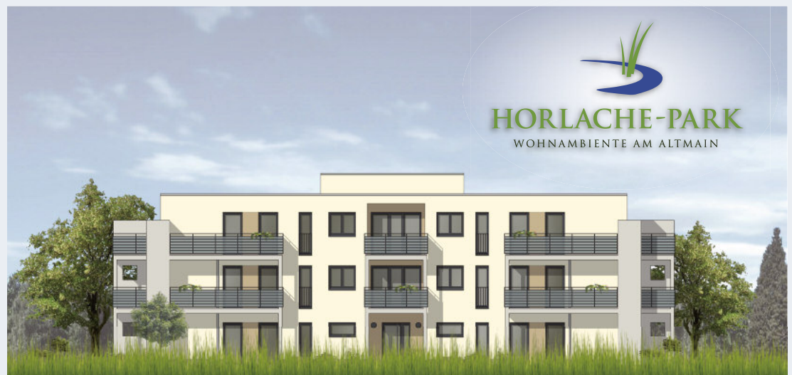
Die Skizze zeigt das Wohnhaus der Bauabschnitte II, III und IV, die bis 2016 realisiert werden sollen