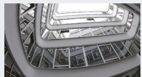
Spendet viel Tageslicht: Der zentrale Lichthof erstreckt sich über fünf Etagen