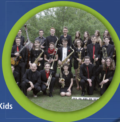
IKS Swing Kids